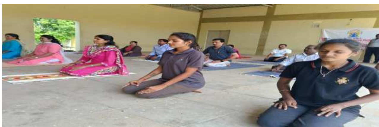
Instructor, Staff, NSS Volunteers and Students