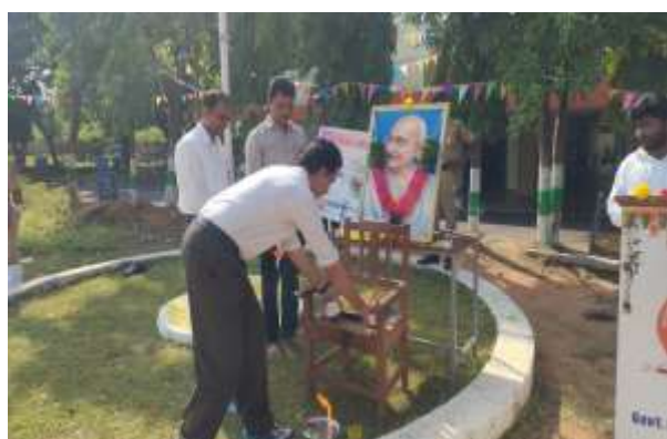
Principal paying homage to the Father of the Nation