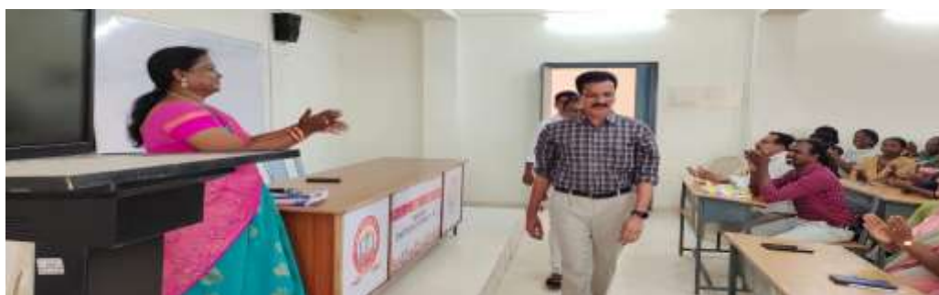
Fashion show by the faculty