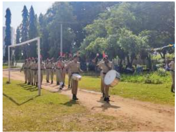
Guard of Honour