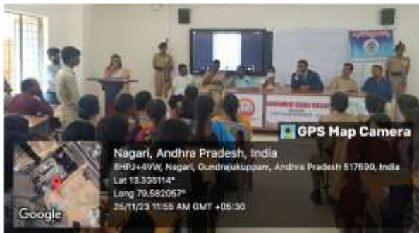
Honourable Judge interaction with the students