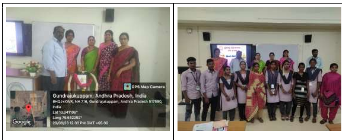
Staff paying tribute to Gidugu Ramamoorthy Panthulu