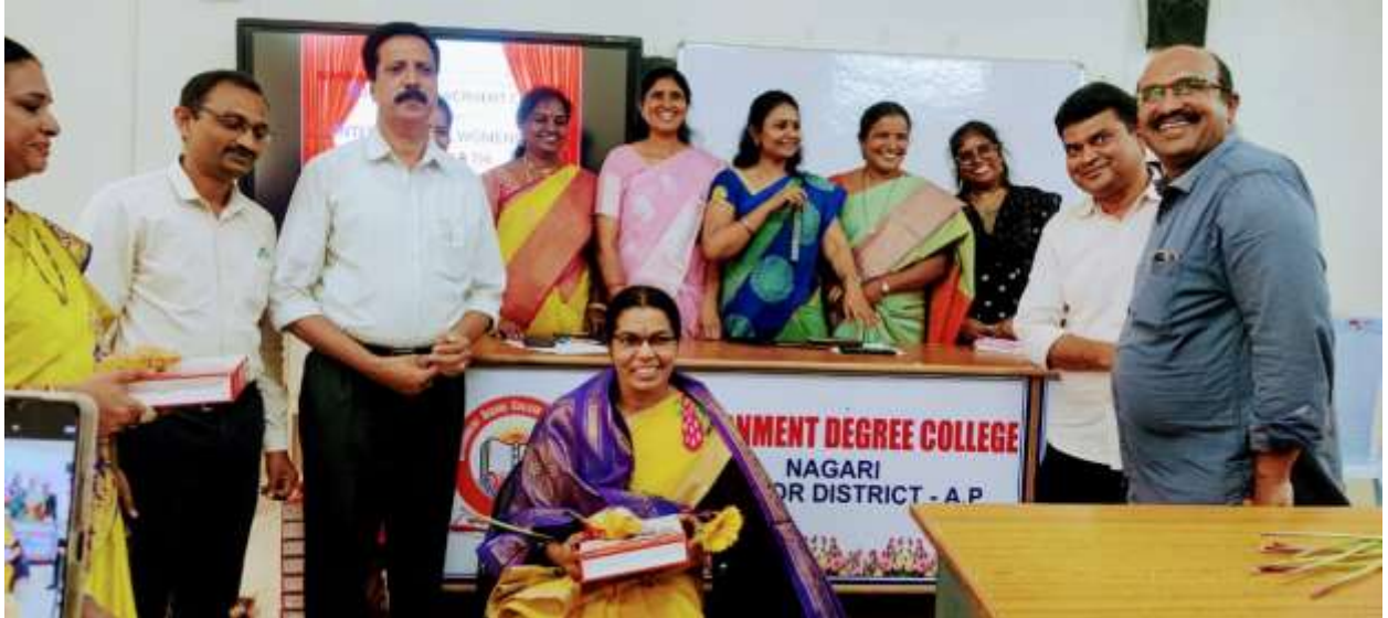
Felicitation to the lady staff members