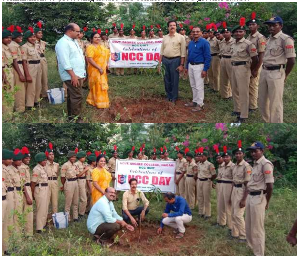
Principal, Vice-Principal, NCC ANO & IQAC Coordinator planting saplings

A tree plantation drive was organized as part of the celebrations to promote environmental awareness and sustainability. NCC cadets, along with the dignitaries, planted saplings on the college premises, reinforcing their commitment to protecting nature and contributing to a greener future.