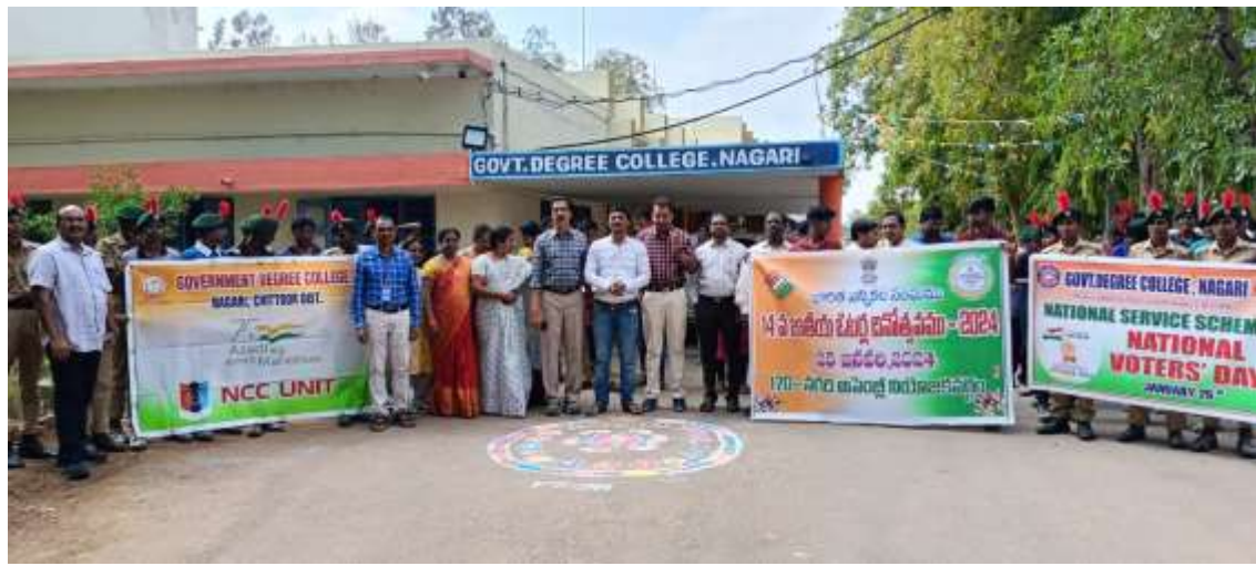
Addressing by the Mandal Revenue Officer, Nagari