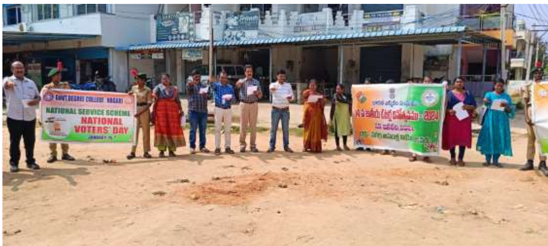
Human Chain formed to take the Voters Day Pledge.