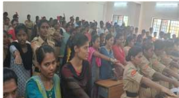
Oath taking by the staff and students