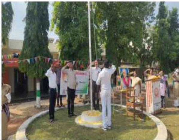
Saluting the National Flag