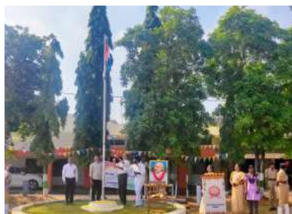
Flag Hoisting by the principal