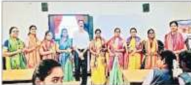
మహిళా ఉద్యోగులను సజ్జానిస్తున్న ప్రీన్సిపాల్ తదితరులు