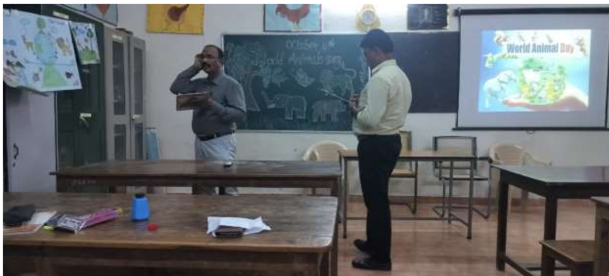
Judges giving marks