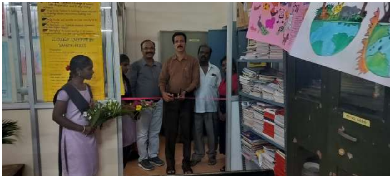
Opening of Poster gallery by Principal