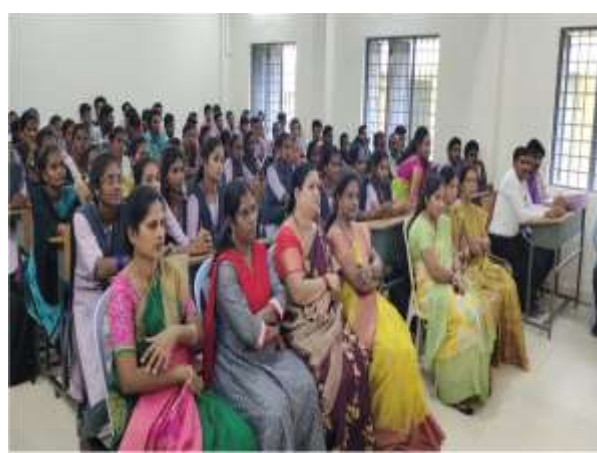
Staff and students attending the programme