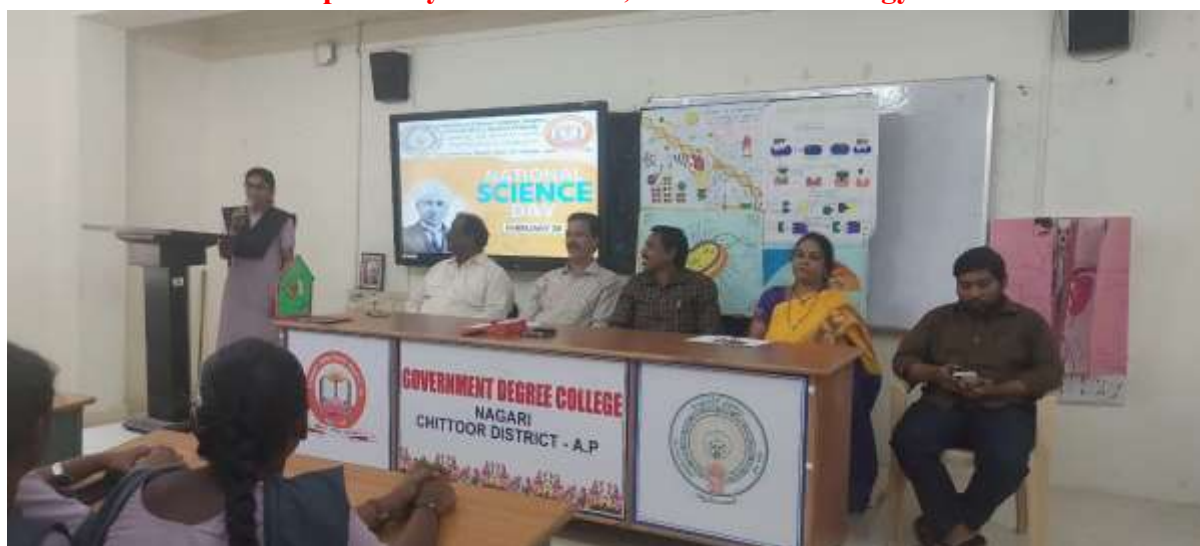
Speech by the student Hemavathi II BZC