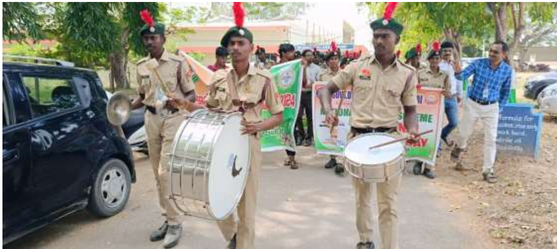
Drums by the NCC Cadets to grab the attention of the Public